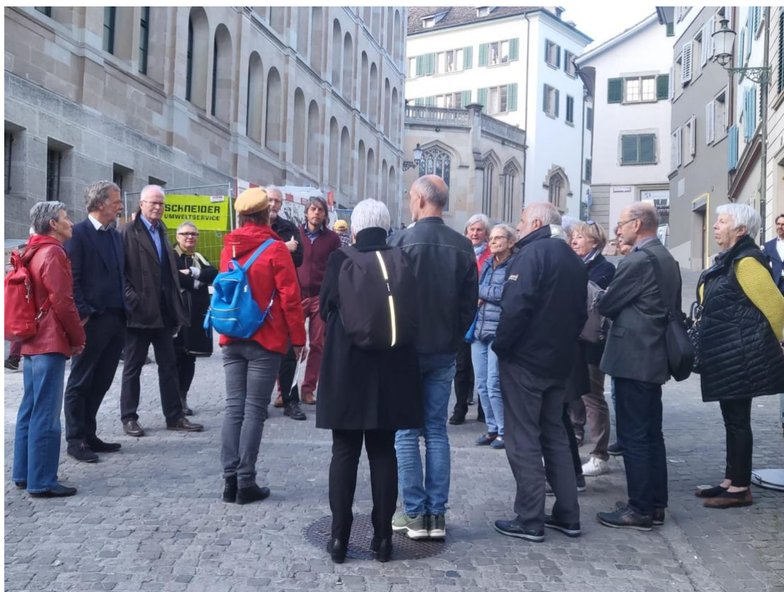
Assemblea generale 2024 a Zurigo